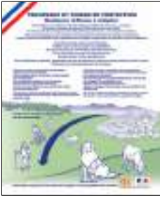
Panneau "Espaces protégés" interdisant les chiens de compagnie tenus en laisse et autorisant les activités cyclistes.