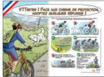
Panneau « VTT » spécifiquement conçu pour sensibiliser les cyclistes.