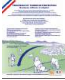
Panneau "Espaces protégés" interdisant les chiens de compagnie tenus en laisse et les activités cyclistes.